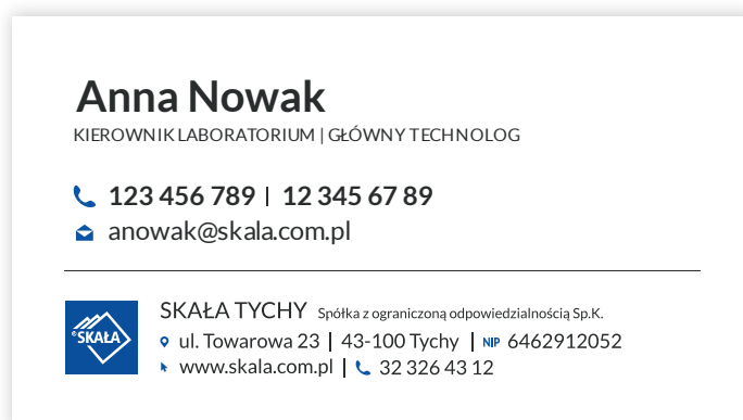
Podstawowa wersja wizytówek imiennych