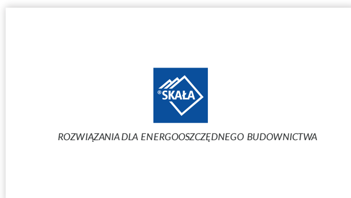
Podstawowa wersja wizytówek - rewers