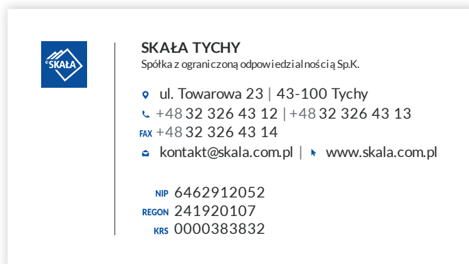
Podstawowa wersja wizytówek firmowych

Czcionka: LatoRegular, Kolory: PANTONE 286, PANTONE Cool Gray 11, PANTONE Black C